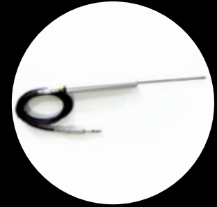
Kontaktprobe (Kondensatableiter Kugellager) Réf. LKS PROBE