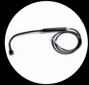
Flexible Sonde 400 mm Réf. LKS FLEX