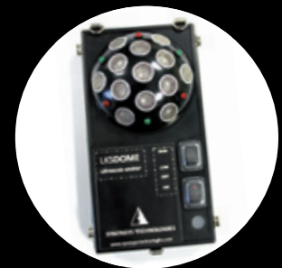
Ultraschallsender Réf. LKS DOME