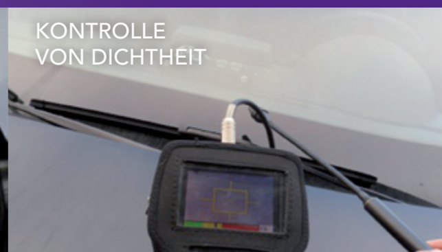
KONTROLLE VON DICHTHEIT