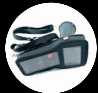
Schutzhülle Réf. LKS COVER